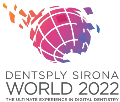
Abb. 1: Die DS World 2022 findet vom 15. bis 17. September im Caesars Forum in Las Vegas, Nevada, USA, statt.